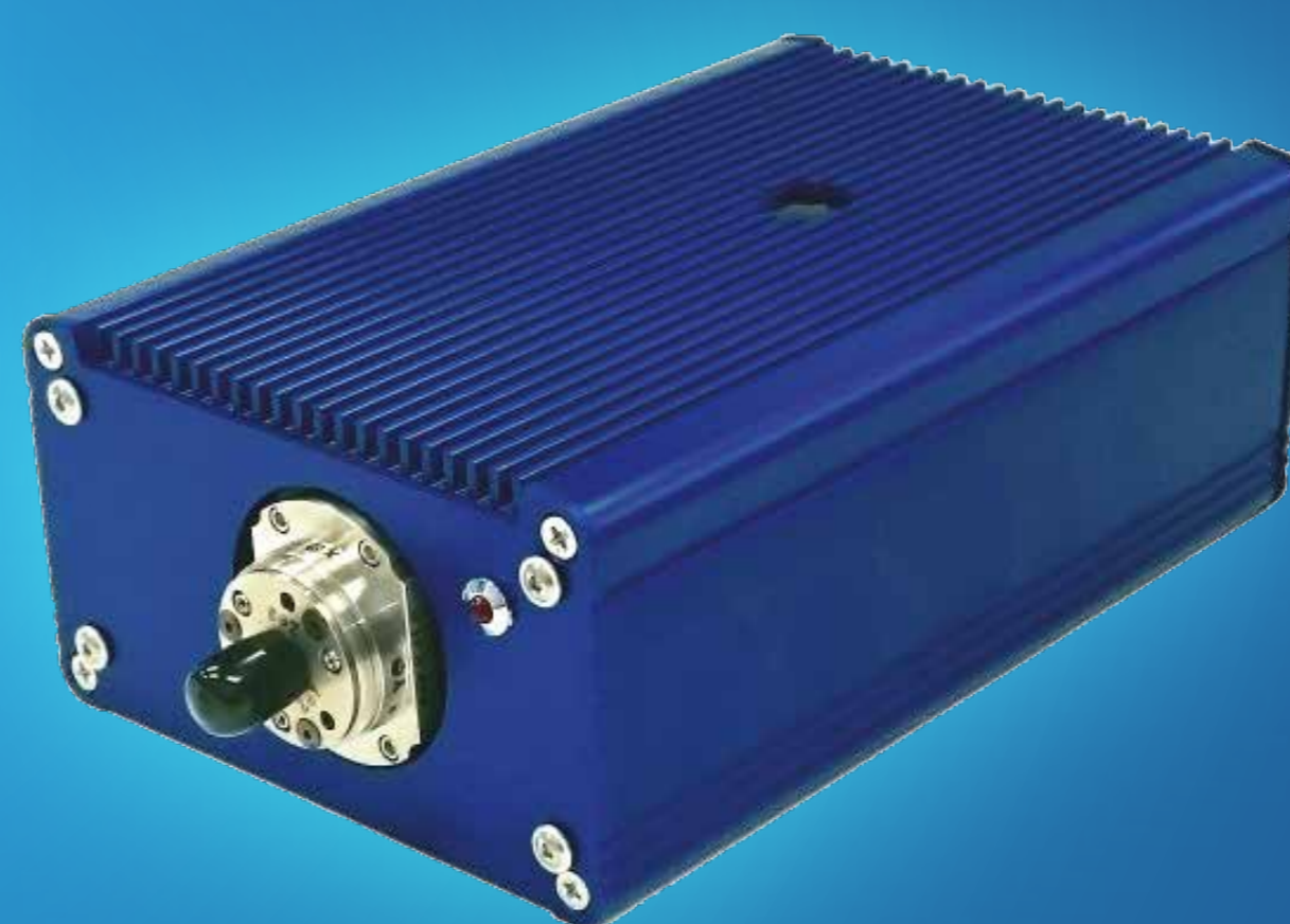
\lambda -Lock 制御ボックス, レーザヘッド